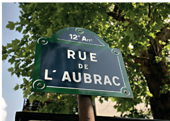
Rue de l'Aubrac Paris 12 e